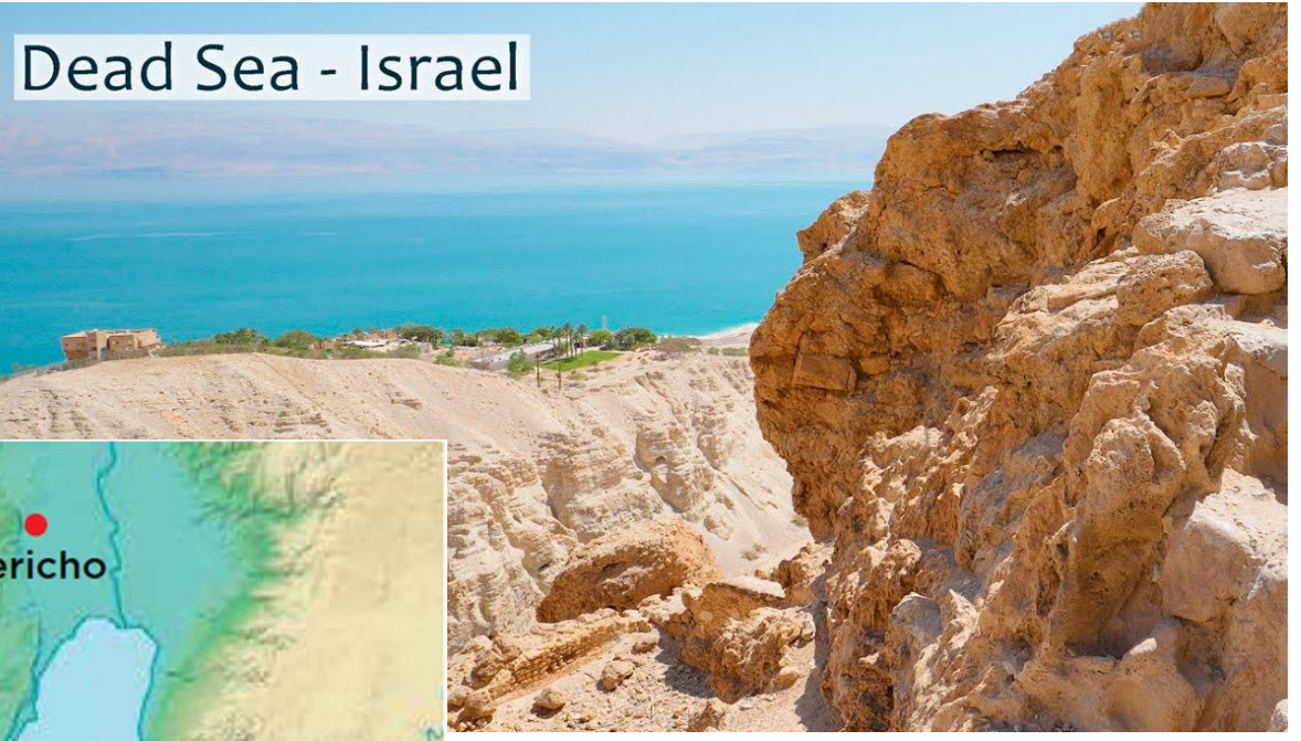
Dead Sea - Israel