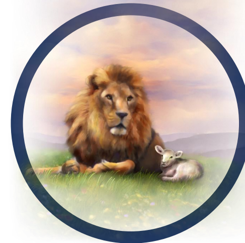
4 | Hongeren en dorsten