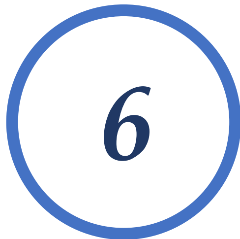
6 | Rein van hart