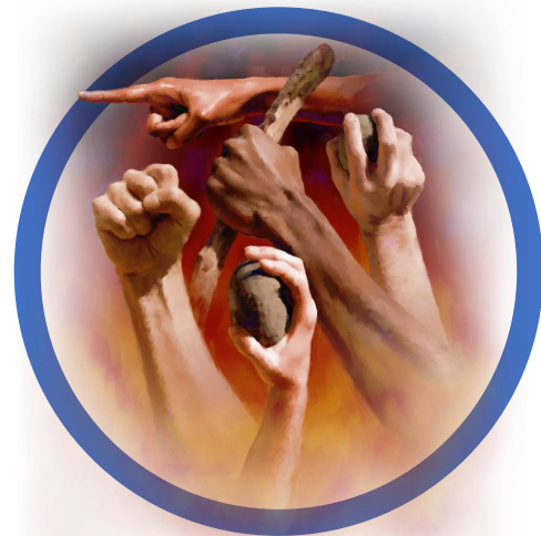
2 | Zie je eigen gebreken