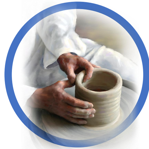
3 | Laat God je leven veranderen