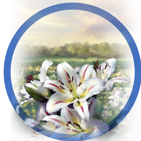
6 | Leef uit een zuiver hart