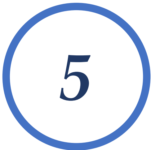
5 | Barm- hartigen