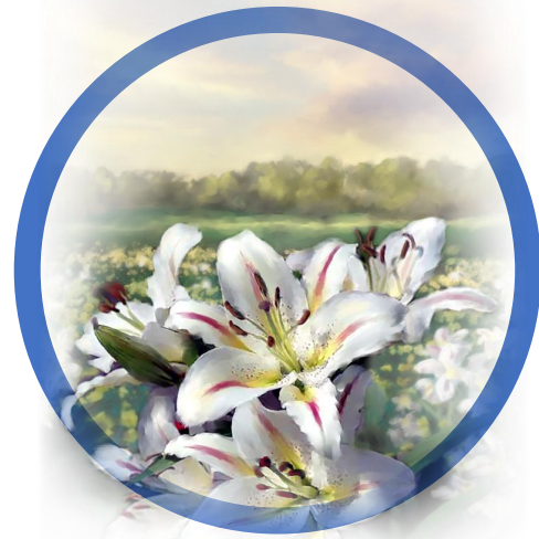
6 | Leef uit een zuiver hart