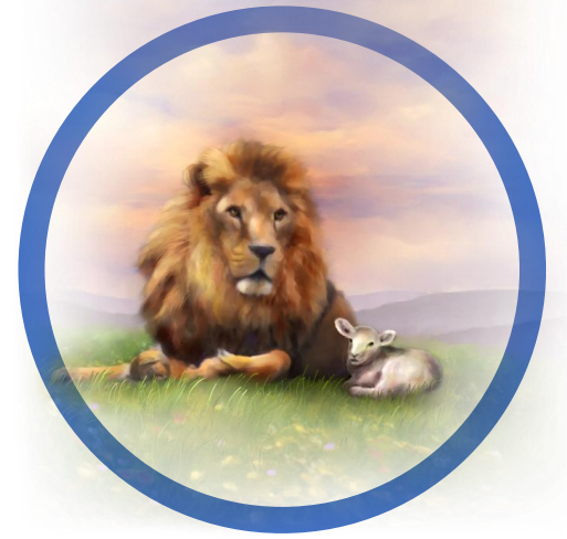
4 | Verlang naar Gods wereld