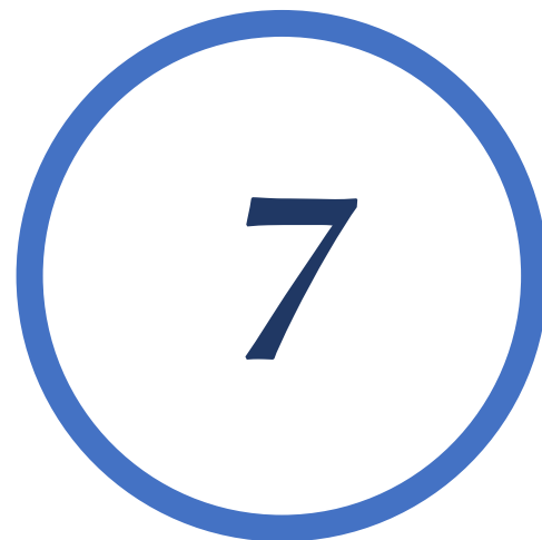
7 | Vrede- stichters