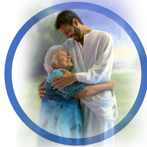
7 | Breng ware vrede