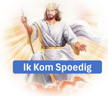
Ik Kom Spoedig